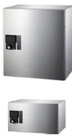
宅配ボックス 上：大型 下：小型

楽天やアマゾンなど、インターネット通販が増える中で宅配ボックスの需要が高まっています。その需要は単身世帯だけでなく、共働きが増加しているファミリー世帯でも需要が高まっています。最近ではインターネットを介して、配達時の通知がなされるものもあります。既存住宅においてはまだ設置率が低く、物件の差別化になります。